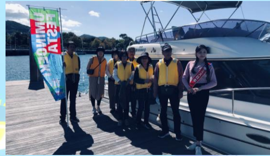
12時半 クルージング参加者様