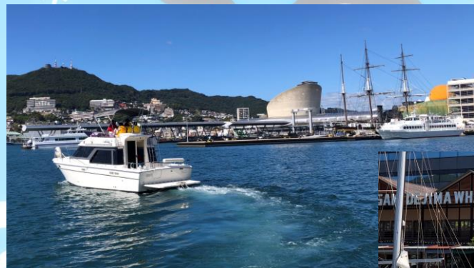
クルージング艇サロンクルーザー32Feet

世界遺産： ジャイアント・カンチレバークレーンは1909年（明治42年）に竣工した同型としては日本で初めて建設された電動クレーン。