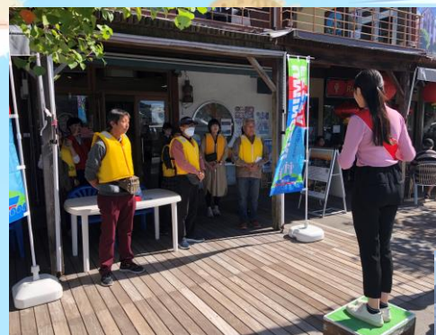
ミス準日本から参加者の皆様へご挨拶