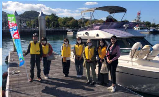
10時クルージング参加者様